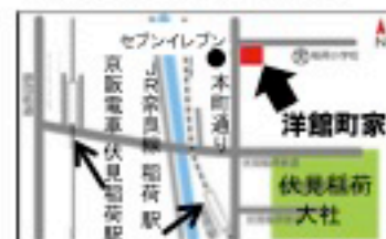
伏見稲荷大社から本町通りを北へ約100m。セブンイレブンの真向かい